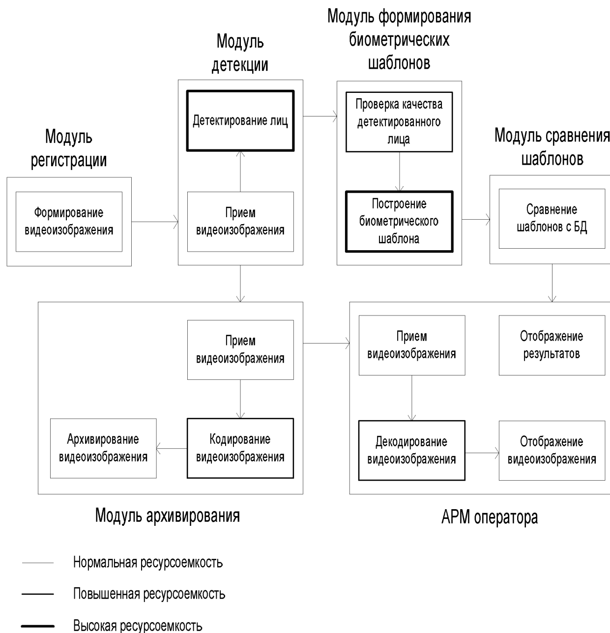
Рисунок 1 – Пример построения архитектуры системы идентификации

Эффективное использование ресурсов ВИ должно быть обеспечено за счет равномерного распределения нагрузки между модулями, выполняющими одинаковые функции.